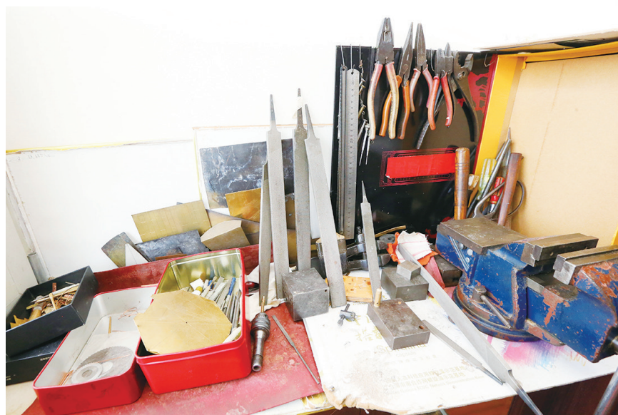
手工制作模型的工具。