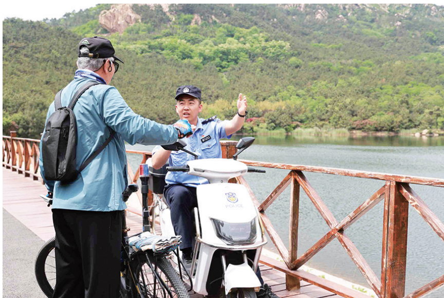
警务站民警在公园内服务市民游客。

接入警务站综合指挥室,每日开展视频巡检和无人机超视距巡查,精准指导地面巡防,及时发现、快速处置各类危险苗头,对临水、陡坡等危险区域通过无人机喊话等形式进行安全语音提示,构建“高空无人机+低空视频监控+地面巡逻警力”空地一体、人机互动巡防模式。