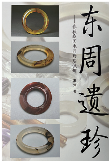
王炜隔几天都会把自己收藏的宝贝拿出来观看。