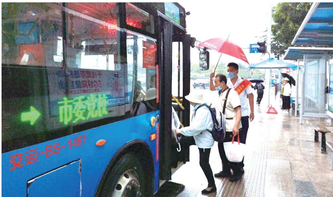
志愿者在为乘客撑伞。