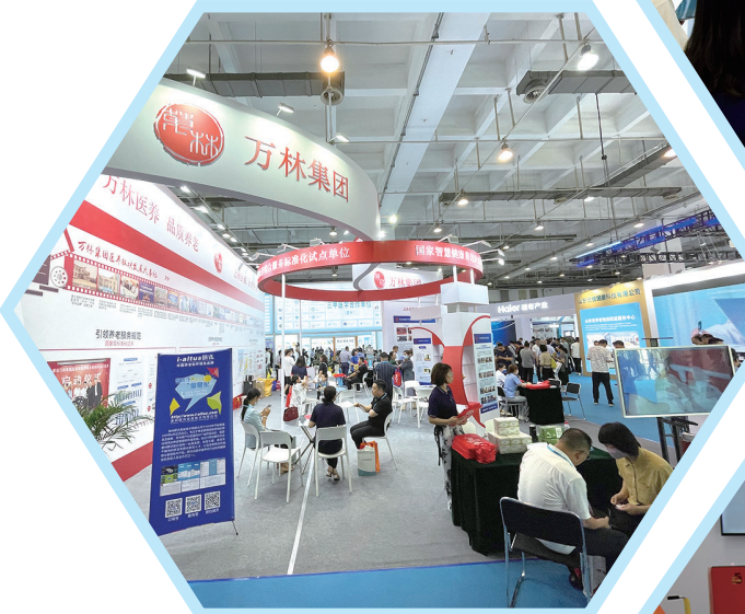
万林集团亮相康养产业博览会。