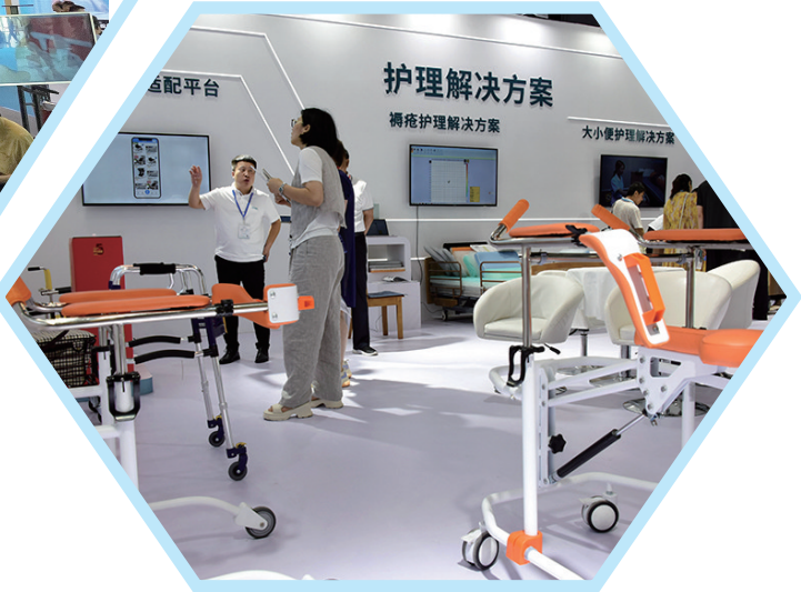
展会上的“护理解决方案”。

是转向医养康养、慢性病管理、健康管理、自我实现等发展型需求。老年人的身体机能变化和服务需求体量增长,也将促进养老机构根据需求适时调整服务功能,推动医养康养功能转变与提升,在激烈的市场竞争中生存发展。