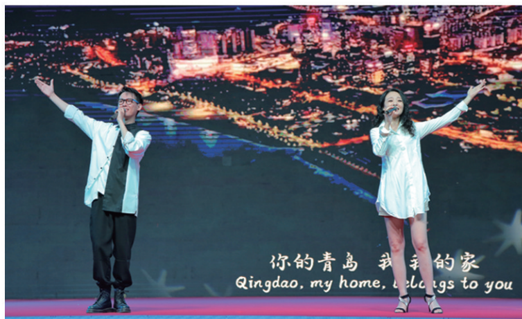
组图:青岛各区(市)推出丰富多彩的文化活动。