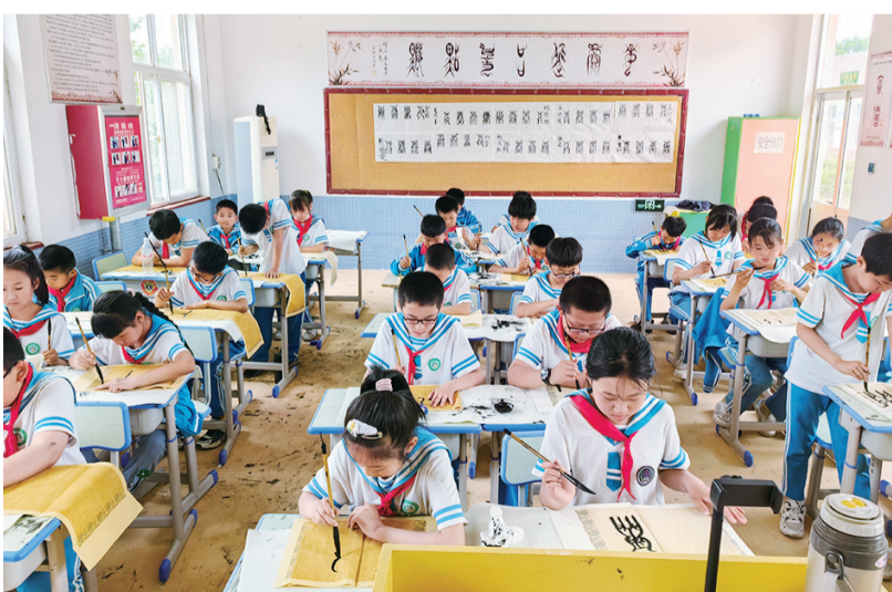
课堂上学生们学习《鸟虫篆》。

“我第一次见到‘鸟虫篆’就被它深深吸引,它不仅美丽奇特,还有很多有趣的小故事,我们一边写字一边了解历史人物和他们的故事。”学校五年级一位同学在体验了第一节“鸟虫篆”书法课程之后开心地说道。在大王邑小学的“鸟虫篆”课堂上,学生从了解