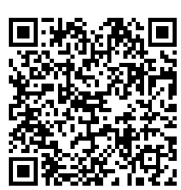
扫码查看“金融 10 条”具体内容

特色金融产品,向市场主体发布并定期更新,年底评选展示全市十佳制造业特色金融产品。 当前,受多重因素影响,制造业企业仍面临不小的经营挑战,《措施》的出台将进一步助推青岛制造业发展。记者从人民银行青岛市中心支行获悉,今年截至 5 月底,全市制造业贷款余额 3594.3 亿元,同比增长 20.2%。其中制造业中长期贷款余额 2323.8 亿元,同比增长 37.2%,高于各项贷款 25.1 个百分点,为制造业发展提供了良好的金融环境。 (观海新闻/青岛早报记者 邹忠昊)