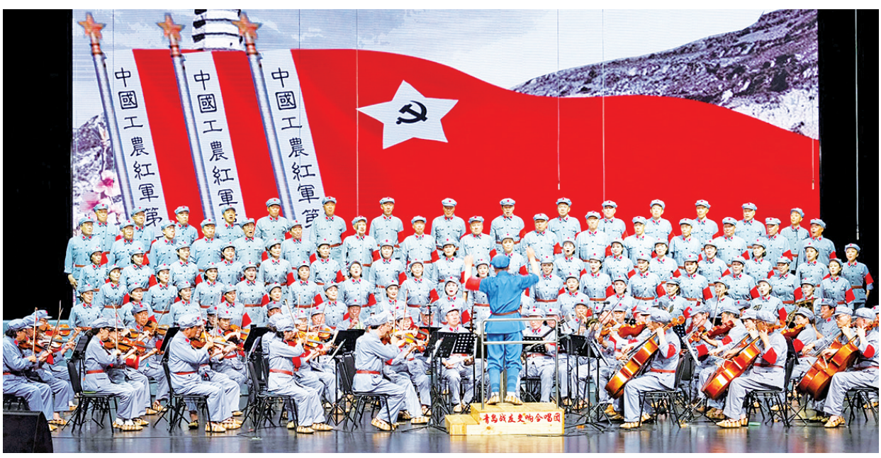
大型声乐套曲《长征组歌》演出现场。

早报 7 月 2 日讯 7 月 1 日晚,为庆祝中国共产党成立 102 周年,由青岛战友交响合唱团演出的大型声乐套曲《长征组歌》在博兰斯勒(青岛)大剧院唱响。整场演出“原音重现”了 1965 年首演的《长征组歌》,让现场观众在更加了解长征这段历史的同时,也更深刻地体会了不畏艰难、不怕牺牲的“长征精神”。