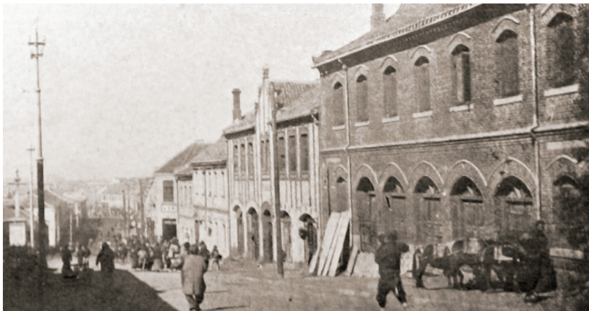
百年前海泊路孟氏家族院落外立面。