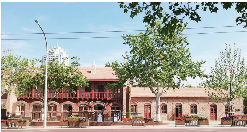
2023年5月,修缮中的青岛瑞蚨祥旧址。

今胶州路35号建筑为青岛瑞蚨祥旧址。该老字号创建于1904年,是青岛最早的绸布商店,已有一百多年历史。瑞蚨祥由山东章丘孟氏家族创办,是闻名海内外的绸布老字号店铺。青岛瑞蚨祥是孟氏家族“祥”字号企业之一。孟氏家族是20世纪二三十年代中国著名的商业家族,经营的商号和企业遍及全国,其中绸布商店就有近500家,茶叶商店20家。在孟氏众多“祥”字号商号中,庆祥、瑞生祥、隆祥的历史最悠久,但论商号发展规模以及驰名程度,则非瑞蚨祥莫属,其在济南、青岛、烟台、北京、天津等十余地设有分号,这些商号均是当地著名的老字号,影响深远。