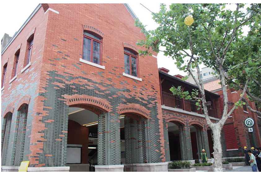
地铁1号线中山路站A出入口风貌建筑全貌。

早报6月29日讯 记者了解到， 地铁2号线海信桥站于6月30日正式 开通，地铁1号线中山路站A出入口、 胜利桥（纺织谷）站C2出入口也将同 日开通。