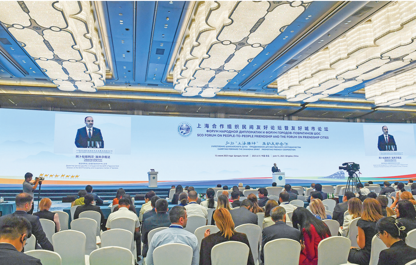
上海合作组织民间友好论坛暨友好城市论坛在青岛开幕。

早报6月15日讯 据大众日报消息,15日上午,上海合作组织民间友好论坛暨友好城市论坛在青岛国际会议中心开幕。全国政协副主席、上海合作组织睦邻友好合作委员会主席沈跃跃出席开幕式并致辞;吉尔吉斯斯坦副总理拜萨洛夫,白俄罗斯国民会议代表院副主席米茨克维奇,省委书记林武致辞;省委副书记、青岛市委书记陆治原主持。 沈跃跃在致辞时表示,上合组织始终推动友好合作,走出了富有上合组织特色、契合各国发展需要的民间友好之路。我们坚持落实元首共识,壮大民间友好力量,搭建民心相通桥梁,助力各国共同发展。习近平主席在党的二十大上指出,构建人类命运共同体是世界各国人民前途所在。我们要做“上海精神”的践行者、世代友好的传承者、共同发展的推动者和包容互鉴的促进者,汇聚民间友好力量,拓展国际友城合作,为推动构建更加紧密的上合组织命运共同体贡献智慧和力量。 林武在致辞时说,近年来,山东认真贯彻落实习近平主席重要指示要求,积极服务和融入“一带一路”建设,不断拓展与上合组织国家的地方交流合作并取得积极成效。举办本次论坛,是落实习近平主席在上合组织成员国元首理事会第二十二次会议上重要讲话精神的具体举措,也是推动上合组织国家民间友好交流与友城合作的生动实践。我们将以“上海精神”为引领,用好论坛这一桥梁和纽带,推进民间友好交流、友好城市交流,深化地方经贸合作,拉紧人文交流纽带,努力取得更多务实成果。 杜尚别市副市长萨洛姆佐达宣读了塔吉克斯坦上院主席兼杜尚别市市长埃莫马利的贺信,俄罗斯国家杜马第一副主席、俄中友协主席梅利尼科夫视频致辞,中国人民对外友好协会会长林松添、乌兹别克斯坦民族关系与对外友好委员会主席库尔班诺夫、上合组织副秘书长叶尔梅克巴耶夫、山东丝路众恒产业投资集团有限公司哈萨克斯坦籍经理卡拉马诺娃致辞。 早报6月15日讯 15日下午,上海合作组织产业链供应链论坛暨2023上合组织国际投资贸易博览会在青岛·上合之珠国际博览中心开幕。商务部副部长兼国际贸易谈判副代表凌激,副省长、省政府秘书长宋军继出席开幕式并作主旨演讲,上海合作组织副秘书长叶尔梅克巴耶夫致辞,市委副书记、市长赵豪志出席。 凌激指出,举办上合组织产业链供应链论坛、2023上合组织国际投资贸易博览会,是贯彻落实习近平主席上合组织撒马尔罕峰会重要倡议精神