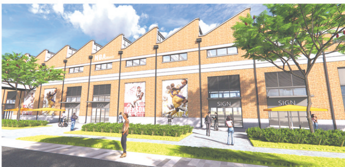
中车四方智汇港二期项目公示。