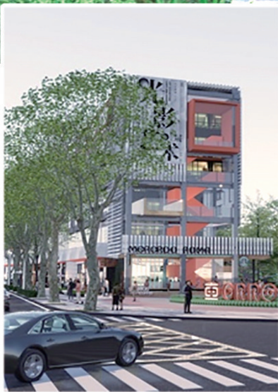
中车四方智汇港二期项目效果图。