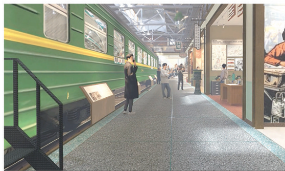
“四方记忆1900”故事馆效果图。

在新样本的打造中,“四方记忆1900”故事馆将作为城市标志性公共文化空间首开呈现。这里是“共和国机车车辆的摇篮”,从南国到雪域,从大海到大漠,从时速200公里到时速600公里,中车四方人用“中国速度”镌刻下中国高铁“金名片”的底色。昔日的工人俱乐部、四方小学、四方书城等年代生活场景,都将完美复刻。用沉浸式的体验和趣味生动的场景展开一段穿越时空的对话,传承百余年精神隽永的机车文化与工业文明,与岛城百姓共建人文“新场域”。