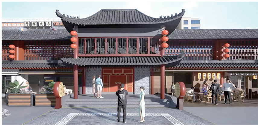
海云庵改造效果图。