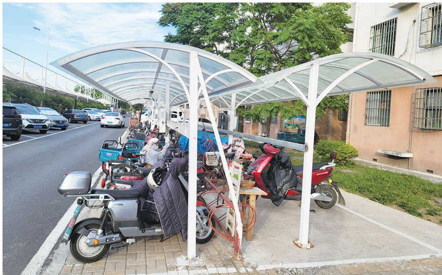
充电棚给居民带来诸多便利。

2022年,在九龙街道的资金支持下,工作人员根据入户调研情况,在小区内又硬化了1600平方米空地,增设