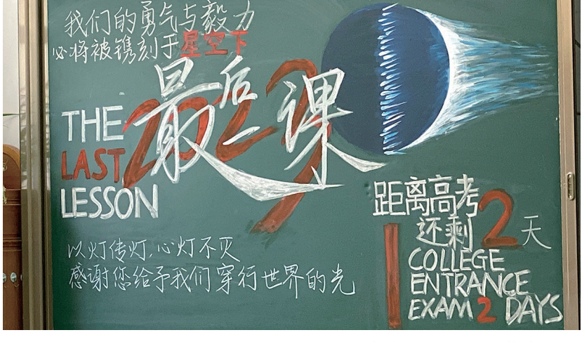
黑板上的“最后一课”格外醒目。