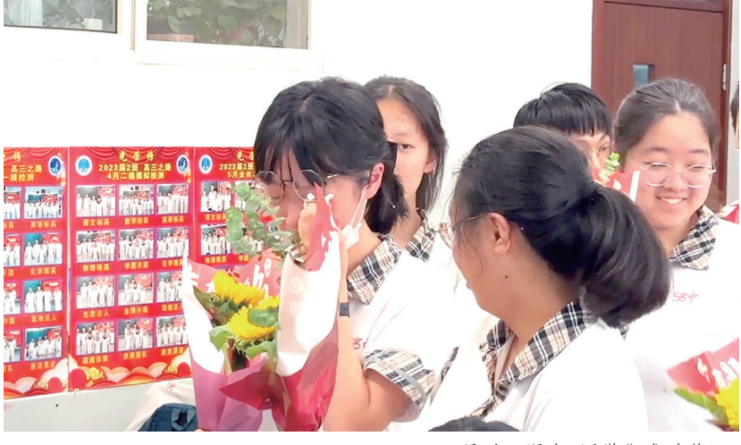
最后一课上，同学们感动落泪。