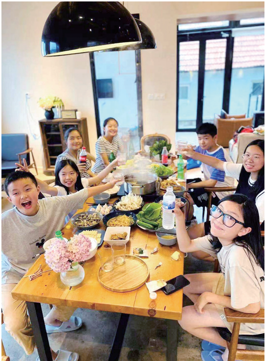
▲游客组团到西麦窑村民宿游玩。

这是一个什么样的发展故事,民宿业给村子又带来了哪些变化,这个民宿专业村今后又将走向何方呢?带着这些话题,早报记者走进西麦窑村,作了一番探访。