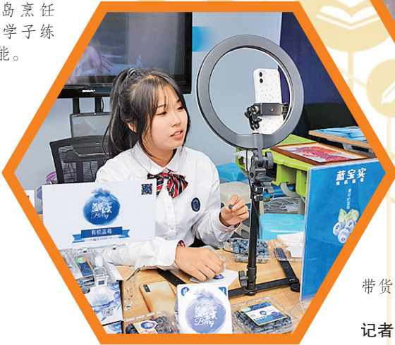
▲青岛烹饪职业学校学子练习专业技能。