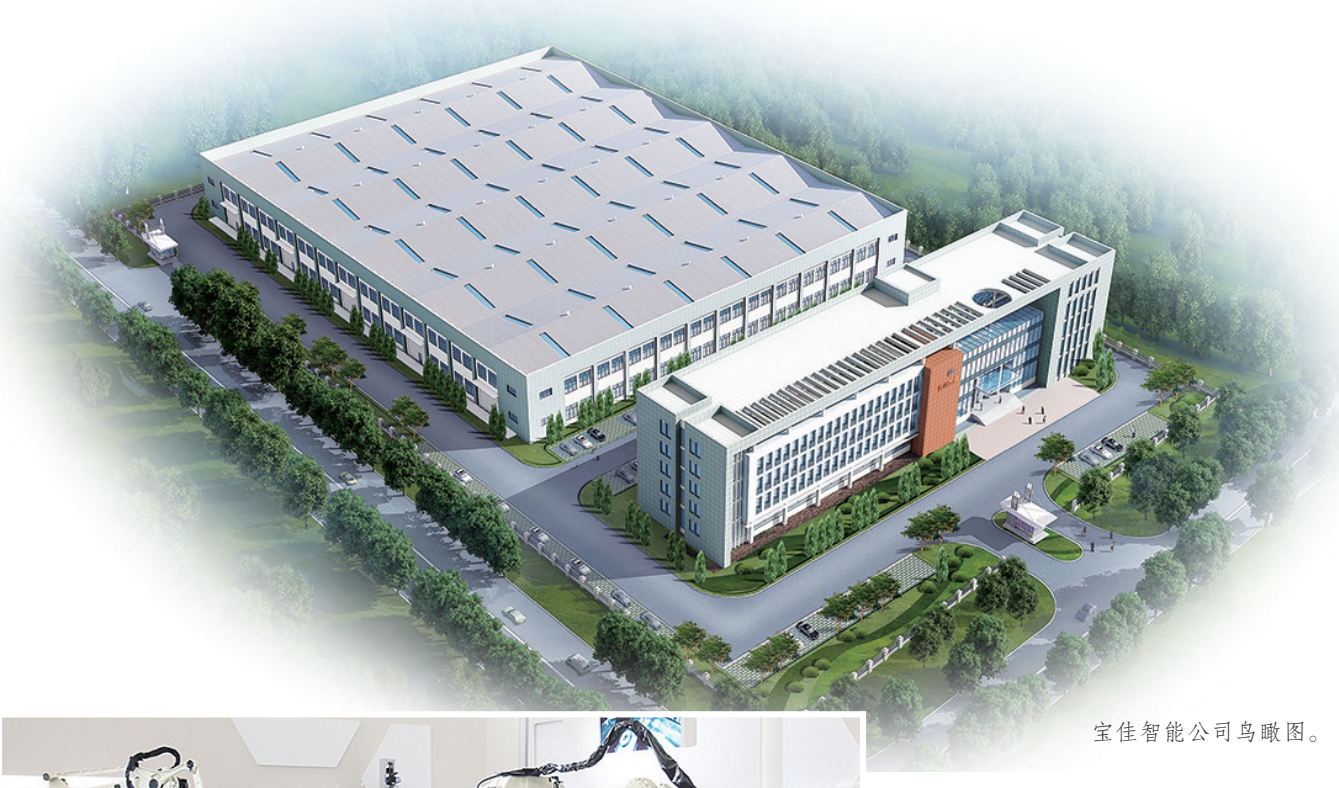
宝佳智能公司鸟瞰图。