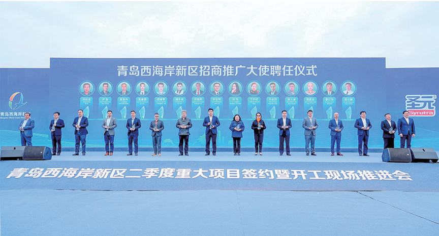
15位知名人士被聘为青島西海岸新区“招商推广大使”。

会上,青島市贸促会对青島市会展政策进行了解读;青島西海岸新区会展办对“西海岸100·2023悠游季”及会展