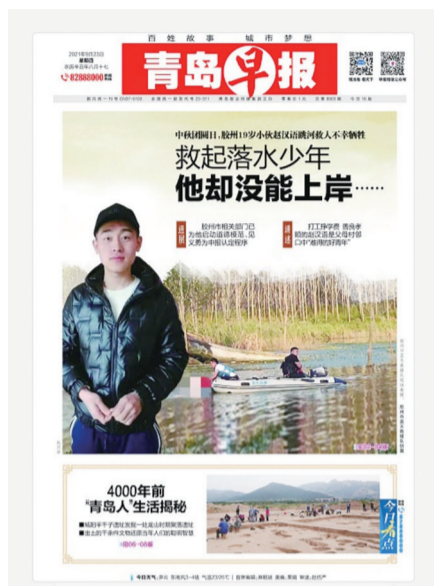
早报报道版面截图。