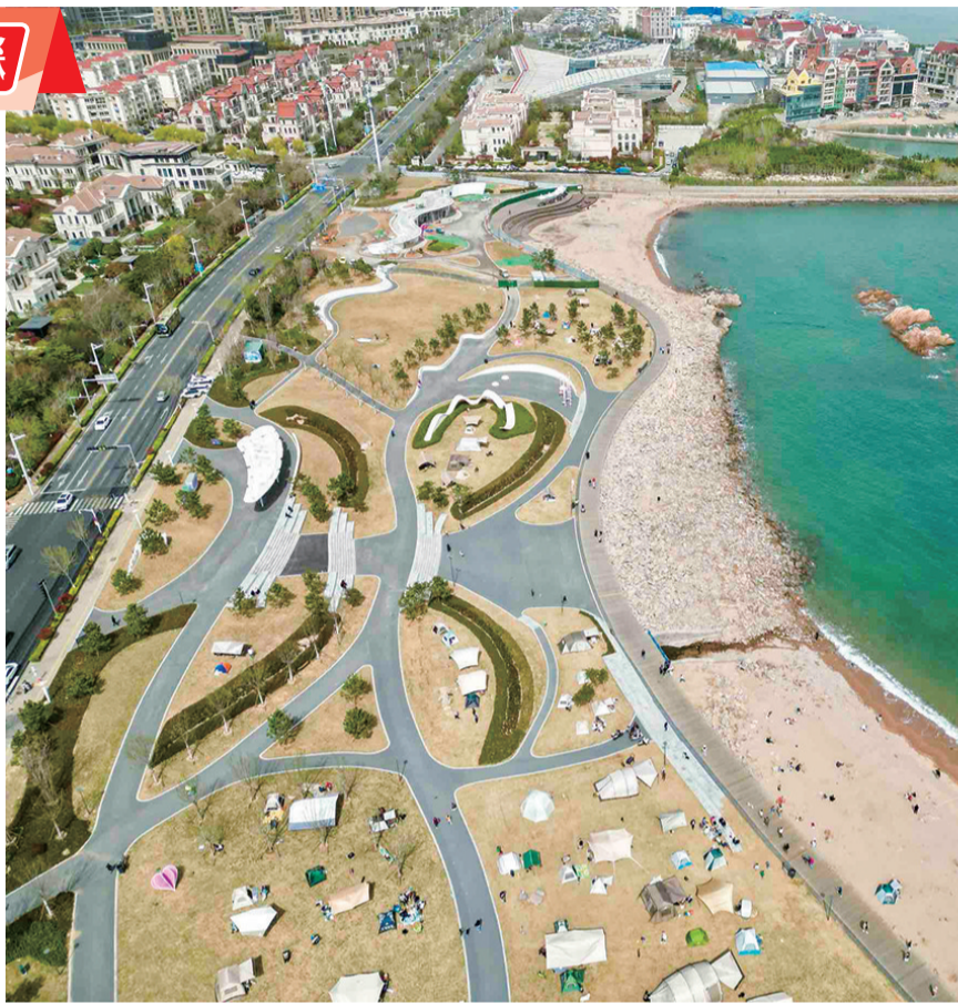
小麦岛附近的海之恋公园绿道。

顺着市北区双峰路一侧拾级而上,双峰路口袋公园便映入眼帘,色彩斑斓的墙绘和地面、袖珍绿植景观、休闲长椅、秋千、滑梯、攀岩墙……它的面积不足100平方米,却布置得令人赏心悦目,吸引了很多附近居民和孩子在此休闲娱乐。“公园旁边就是幼儿园,每天接孙子放学后,他都要在这里玩玩滑梯、荡荡秋千才肯回家。”家住附近的陈女士说,这处口袋公园成了家门口的小小