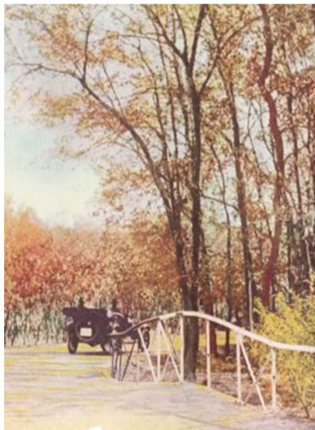
百年前的樱花路上,一辆马车驶过。

第三公园位于今青岛市市北区上海路西,1914年日本占领青岛后,在聊城路一带建起日侨民聚居区,并在其东侧谷地开建“新町公园”,园内遍植樱花,并建有人工湖、假山、回廊,配备石桌、石凳等,专供日人游玩。1922年12月10日正午中国政府收回青岛主权后,不久胶澳商埠督署将新町公园易名第三公园,今公园部分旧貌仍存;第四公园亦建于日本第一次占领青岛时期,位于今中山路、曲阜路、河南路、肥城路之间,毗邻红星影院,是一片较方正的街