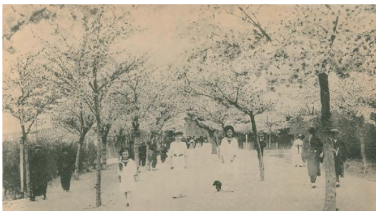
百年前的中山公园樱花季。

心公园,树木仅百余株,时称“深山公园”。青岛主权回归后,易名第四公园。1932年政府将公园土地拍卖,建起中国、山东、上海、金城、实业等数家银行,形成青岛金融机构聚集区,该公园遂不复存在。