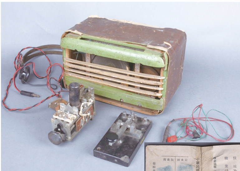
▲1949年青岛地下党使用的电台。

与此同时,市博物馆也向岛城市民发出邀约,一同讲好文物故事。文物是历史的重要见证,是弘扬和传承中华优秀传统文化的生动教材。青岛市博物馆