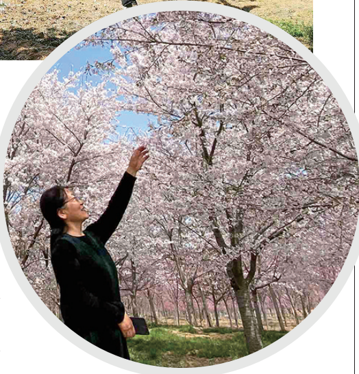
游客们徜徉在粉色的花海。

在六汪镇的青岛樱花谷里,青岛樱花谷科技生态园有限公司拥有国内最专业的樱花管理团队及人才50多名,主要致力于樱花新品种的研发和国内樱花园景区项目的建设,在樱花园景观规划设计、种苗配置供应、建园栽培技术及后期技术管理方面有着丰富的经验,目前樱花栽培总面积达6000多亩,公司的自主研发及科技生产进入快车道,2018年—2021年4月,共有11个自主研发樱花新品种经国家林业和草原局审定颁证。在国家林业和草原局网站上公示的