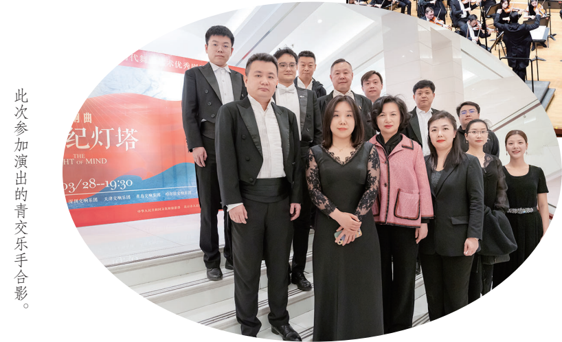
此次参加演出的青交乐手合影。