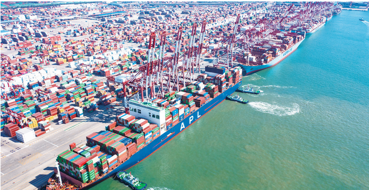
航拍山东港口青岛港。

据了解,在此次开通的航线中,中南美线将全面增强山东港口连通曼萨尼约、布埃纳文图拉等中南美核心港口的服务能力。泰赢航运欧洲航线作为直达