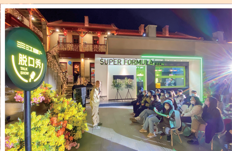
三江里的里院实景演出。