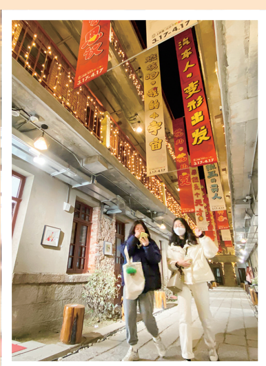
四方路老院里的艺术展。