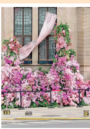
中山路上繁花似锦。