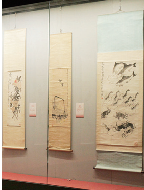
展览荟萃名家名作。