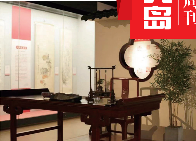
展览现场布置极具书卷气。