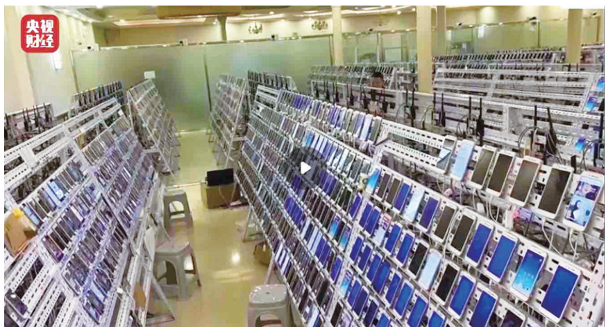
一台电脑同时可控制200到20000部手机,冒充真实用户。

收碰撞能量性能测试,一款红色头盔应声开裂,出现一条20多厘米长的裂痕。记者采访发现,一些厂家为了压缩成本,使用回收料等劣质材料生产头盔。二是耐穿透性能测试,有8款头盔达不到新国标要求,有的几乎被劈成两半。三是测试电动自行车的佩戴装置,有16款产品不符合新国标要求。四是护目镜耐磨性测试,有16款产品不符合新国标要求。