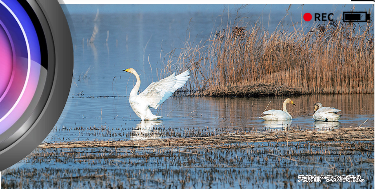
天鹅在产芝水库嬉戏。