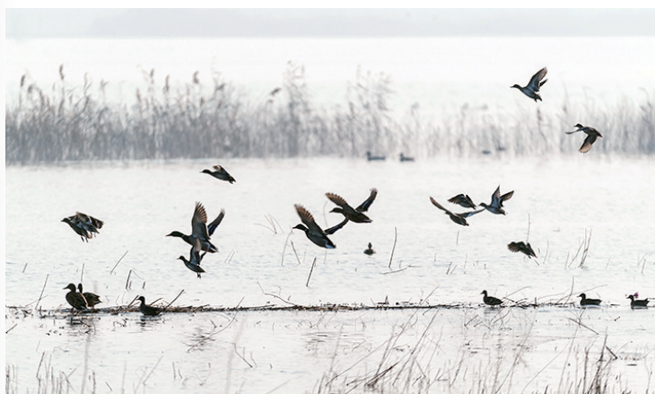
产芝水库成了鸟类天堂。