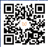
扫码观看 产芝水库候鸟视频