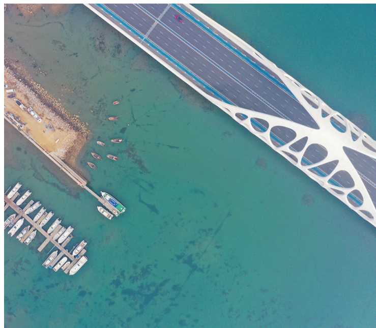
摄影《桥与码头》王孔秀 73岁 市老干部活动中心

青岛早报银龄俱乐部会员持续招募中,在这里,你的书画艺术作品将有在报纸上优先刊登,还可以参与早报组织的各种讲座、采风系列活动。来吧,加入早报这个大家庭,和广大中老年朋友一起老有所学、老有所乐!