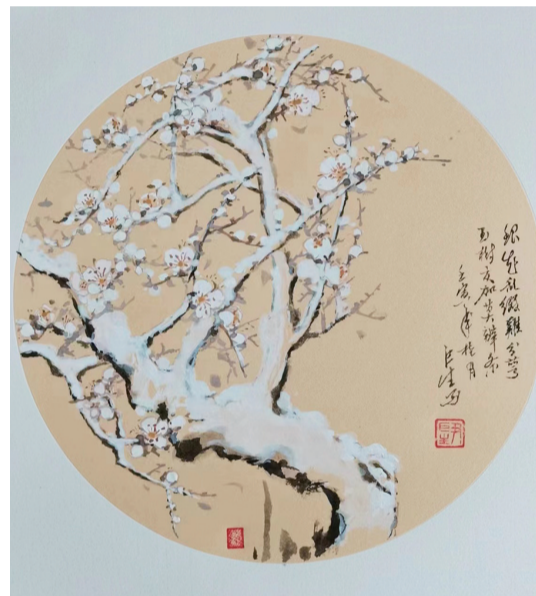
国画 尹巨生 76岁 市军休服务中心