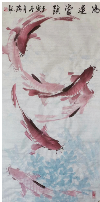
国画 王瑞聪 61岁 市军休服务中心