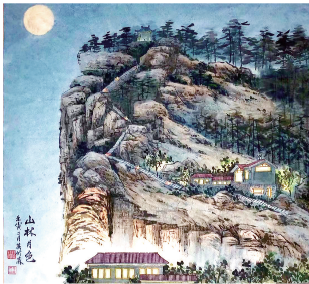
国画 万修森 69岁 市老年大学