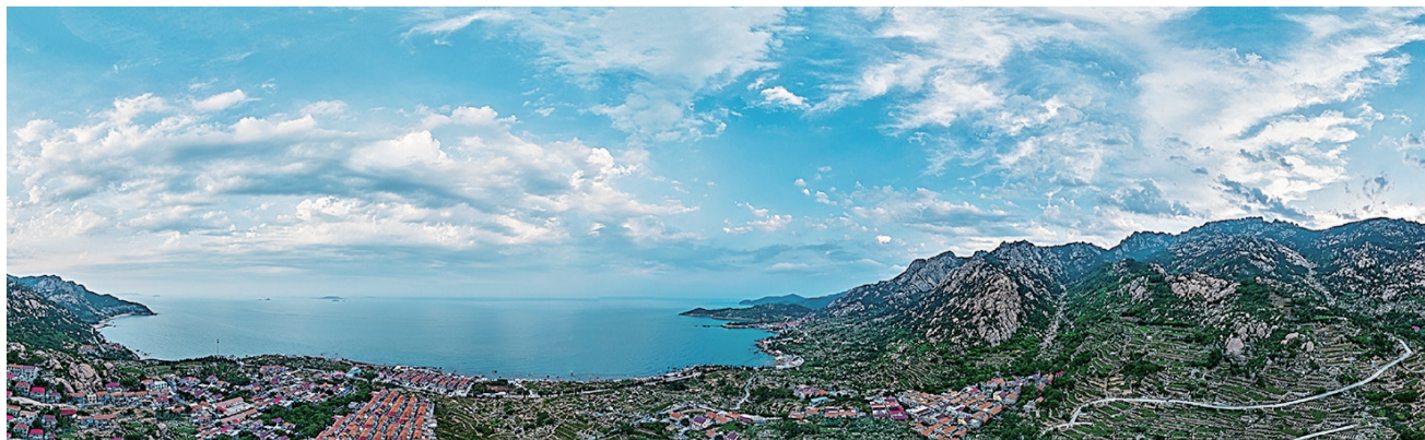
摄影《长岭风光》王永亮 63岁 市老干部活动中心