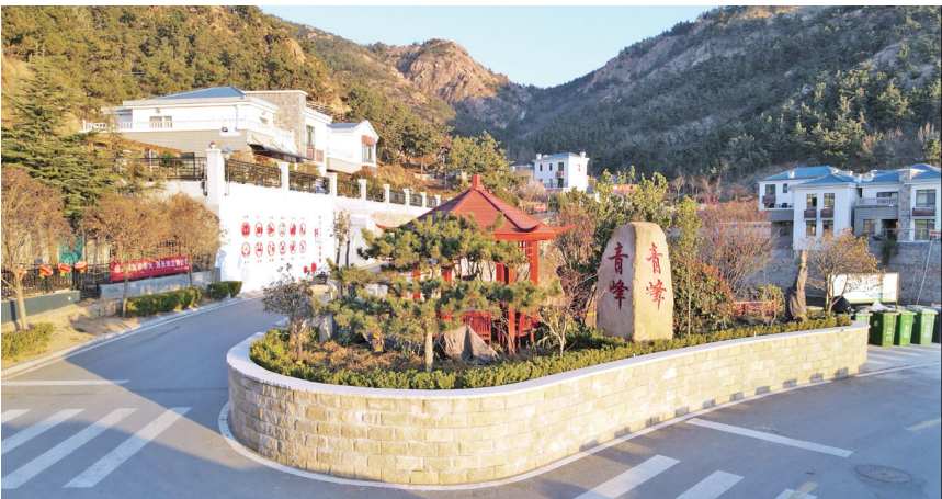
经清华大学建筑设计研究院统一规划设计的青峰村如世外桃源。

近年来,青岛市城阳区惜福镇街道在全面推进乡村振兴过程中,创新实施“一村一品,组团赋能”的产业发展格局,整合自然资源、产业特色、传统文化等优势资源,探索出旅游、产业、文化三种振兴路径,走出了乡村振兴齐鲁样板先行区的“城阳特色”。2月19日,山东发布100个“我喜爱的乡村振兴齐鲁样板”案例,惜福镇街道青峰村光荣上榜。