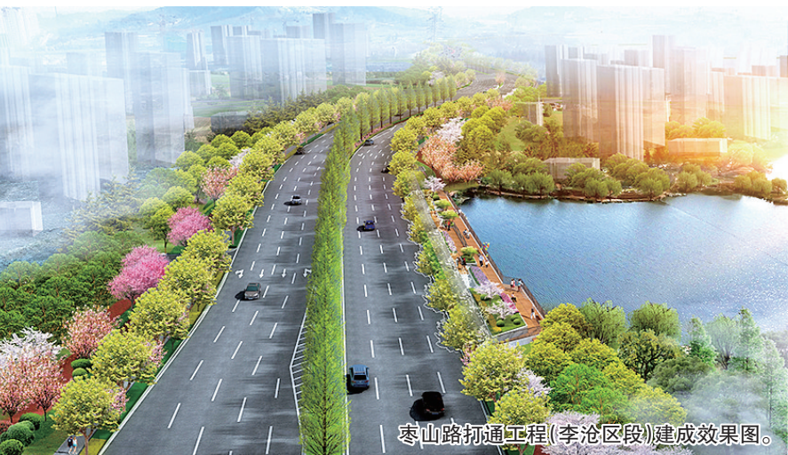
枣山路打通工程(李沧区段)建成效果图。