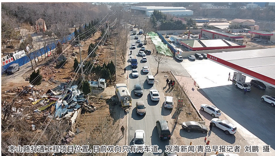
枣山路打通工程项目位置,目前双向只有两车道。