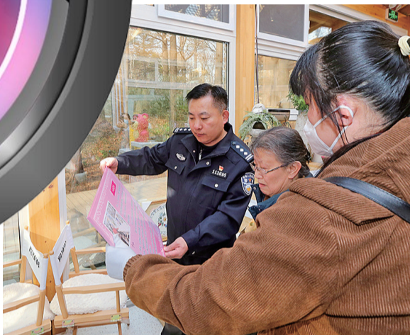
民警给小今母女看他们制作的小今简介。

昨日下午,市南公安分局八大关派出所几名民警和小今母女带着10多幅装裱好的画,一起来到中山公园林荫书屋布置画展。