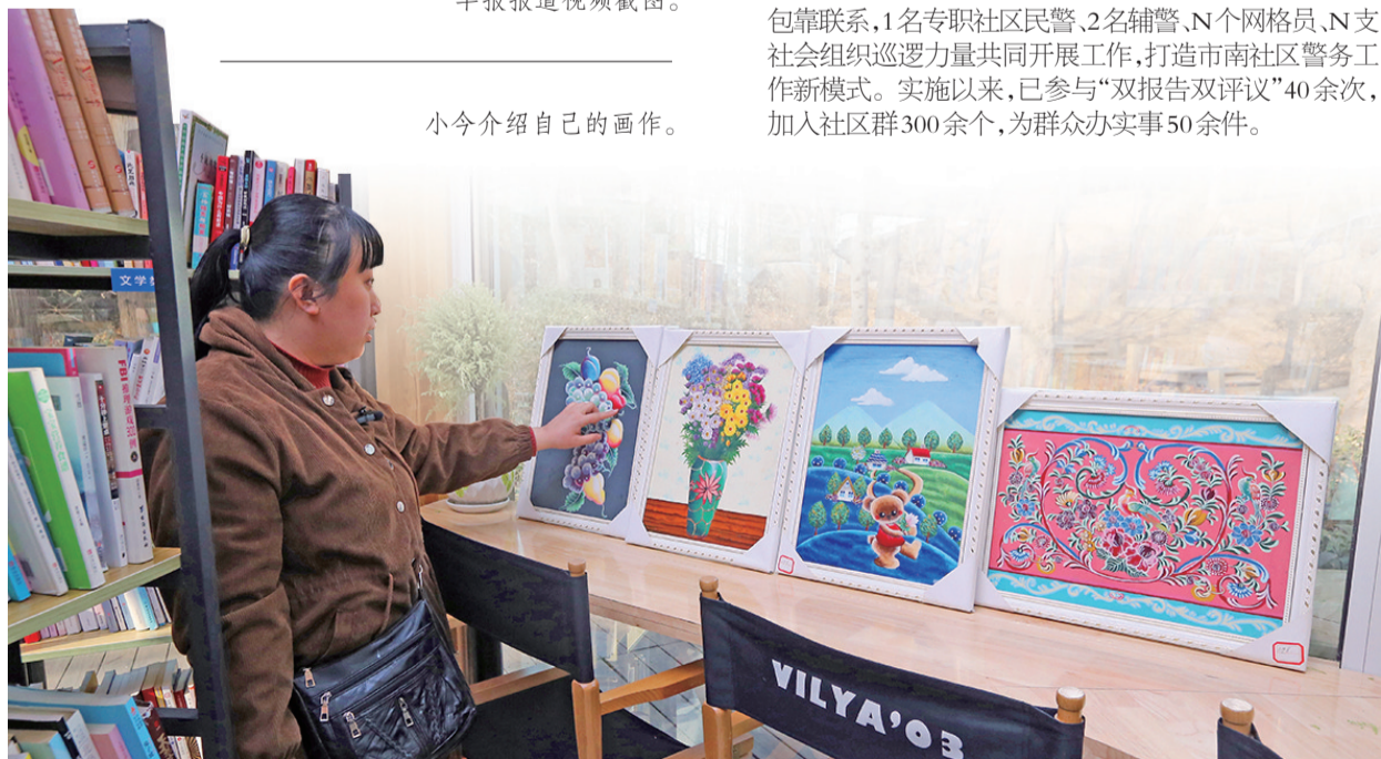
小今介绍自己的画作。