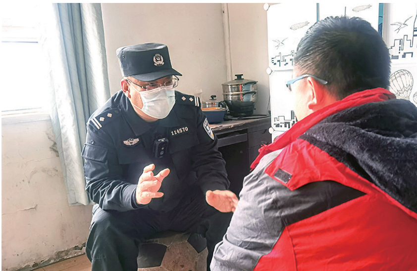
民警开导来青闯荡的小付。