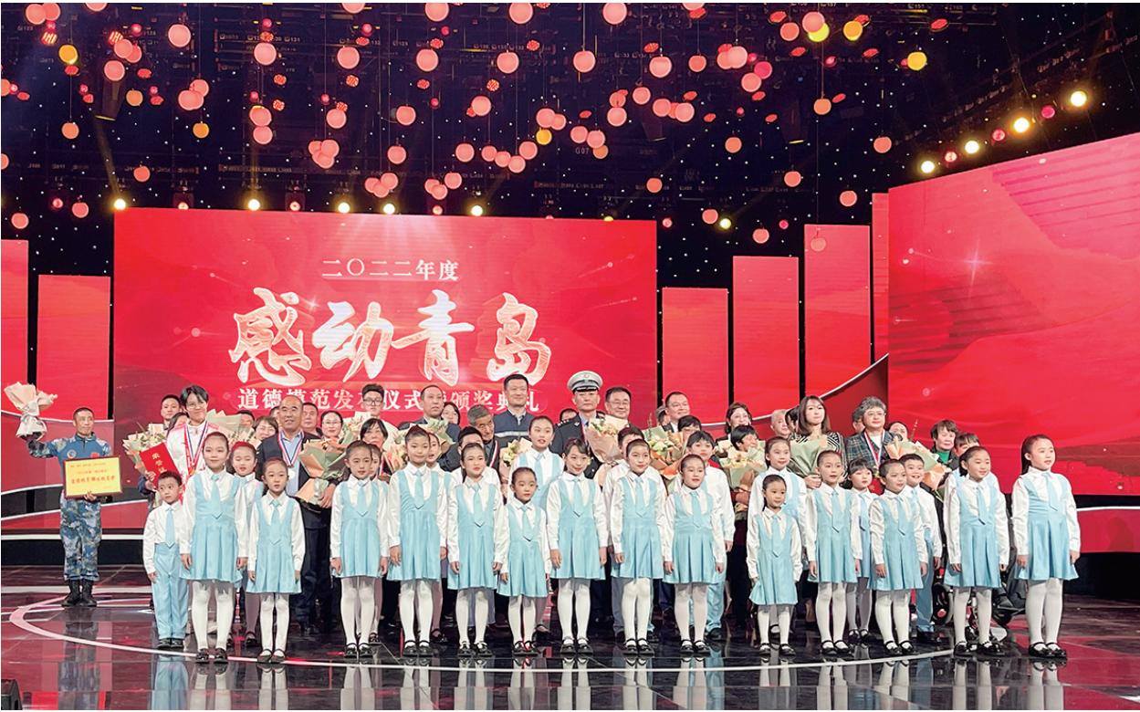
2022年度“感动青岛”道德模范发布仪式暨颁奖典礼现场。