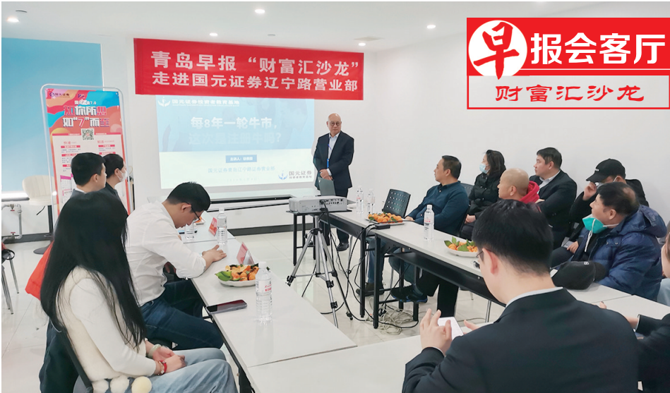
财富汇沙龙举办现场。