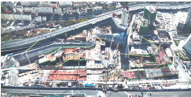
青岛国际邮轮港区启动区地下空间施工现场。