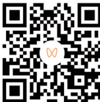
扫码查看视频 视频剪辑 吴冰冰

医生提醒家长,要给孩子养成良好进食习惯,不要边吃边跑。对于幼儿,家长尽量不要喂食花生、瓜子、果冻等不易咀嚼和各类带核的食物。如果家长发现孩子误食异物,不要硬抢,应耐心引导孩子吐出来,以免在抢夺过程中孩子哭闹将异物吞入消化道或气管。一旦发现可能误食,询问孩子了解具体情况,及时就医。(观海新闻/青岛早报首席记者 孙启孟 通讯员 毕乙贺 摄影报道)