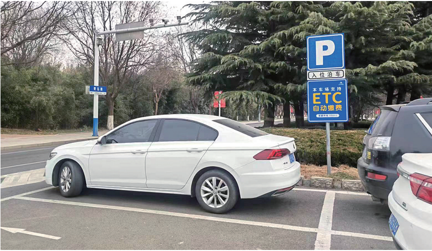
胶州建成全省首个ETC智慧停车县域全覆盖项目。

ETC智慧停车模式就是在原有停车系统增加无感信息传输,可以通过车辆的“ETC”与停车场内的停车信息互通,在停车场实现车辆不停车支付费用