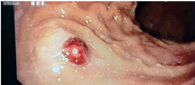
患儿胃中的磁力珠。

互吸引可以摆出不同的形状和图案,很多家长为“提高孩子的动手能力”“开发孩子的创造力”而买下这种网红玩具。