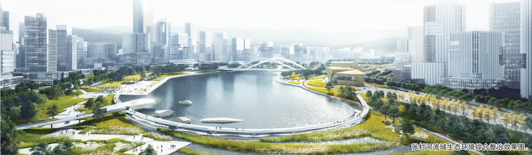
张村河流域生态环境综合整治效果图。

公园城市建设方面。重点推进元宇宙公园建设,新建山头公园、口袋公园7处,打造林荫廊道2条,推进立体绿化10处。