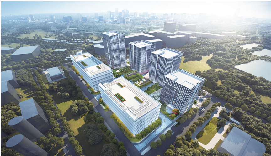
青岛人工智能科技创新中心效果图。

区在城市更新和城市建设攻坚行动全面成势,194个年度项目全面开建,投资完成率达到145%。