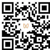
扫码观看四胞胎首次同框 视频剪辑 刘宇航