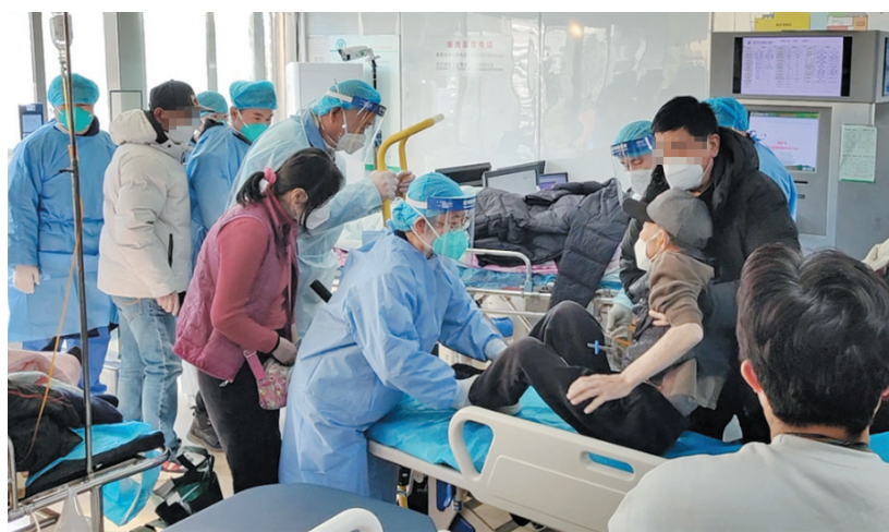
全院人员24小时全力以赴救治生命。

2022年12月下旬,新冠感染高峰过后,重症冲击紧随其后,青岛市市立医院作为全市急诊急救和重症救治的主力医院之一,发热门诊接诊量、急诊留观人数、急诊收住院人数连续多日高居全市三级医疗机构前列,急诊抢救室、急诊监护室、重症医学科……高位运行,压力巨大。医院统筹调配医疗资源,扩充重症床位、增加可转化重症床位,呼吸、重症专家包干巡诊,成立医疗救治运行保障组,全院人员24小时全力以赴救治生命。