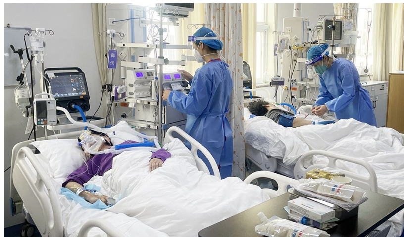
及时、准确、高效救治,赢得宝贵的抢救时间。

安排出院计划或转至下级医院,腾出空间收治新患者;二是各重症监护病房作好重症患者评估筛查工作,将符合转出ICU或病情趋于稳定的患者分流至普通病区,腾出空间承接急诊监护室病人,最大限度减轻急诊压力;三是加