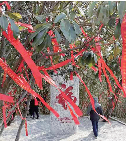
游客在琅琊台拍照祈福。

地址:青岛市西海岸新区灵珠山办事处。 交通方式:可乘地铁1号线至天目山路地铁站 或乘隧道1路区间车、开发区6路定时延长线至珠山景区步行759米即可到达。