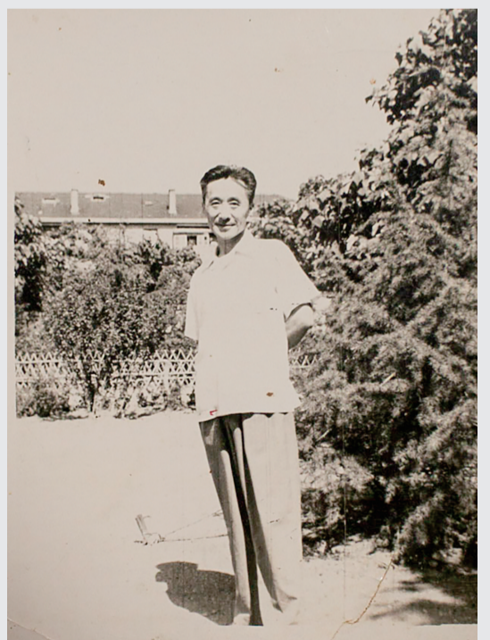
组图:耿林莽生前照片。