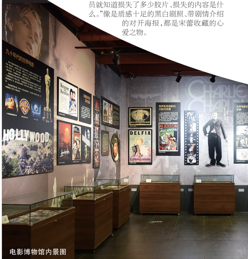
电影博物馆内景图