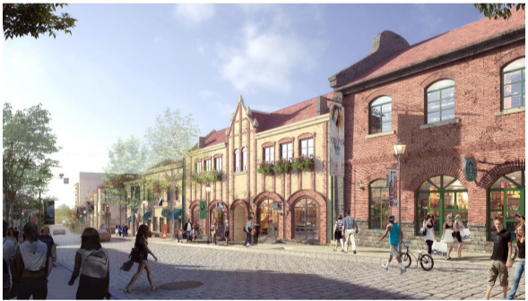
市北区历史文化街区有机更新一期项目设计效果图。