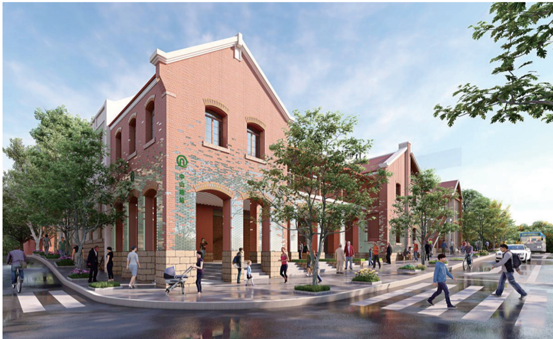
地铁1号线中山路站风貌建筑修缮工程设计效果图。