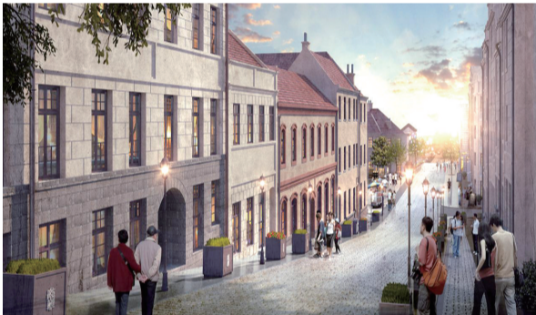
市南区四方路片区改造项目设计效果图。