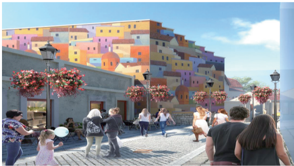
宁阳路(银鱼巷)街区改造项目设计效果图。

早报1月5日讯 为进一步推动我市历史城区保护更新蓬勃开展,打造历史与时尚相结合的魅力老城,挖掘历史城区建筑设计工匠能人,提升建筑设计人才水平,青岛市住房和城乡建设局于去年11月25日至12月1日面向全市征集历史城区保护更新方案设计典型案例。按照评审要求,设计方案需深入挖掘历史文化,在项目方案设计上探索运用青岛本土传统建筑表现形式,融入自然、文化等元素,设计兼具文化内核与艺术美感的高水平方案,在全国、全省范围内具有一定的引领作用。同时方案设计还要着眼于历史文化保护传承要求,尊重场所精神,充分考虑区域现状与周边场地、人流关系,项目设计具备科学化和专业化,具有可行性和操作性。设计方案总体遵循延续文脉、体现传统工艺原则,便于后续实施与修缮维护。另外方案还需要完善功能配套,加强功能策划引导,满足市民物质与精神生活需要。提倡在设施设置、材料选择、景观艺术等方面考虑绿色节能等低碳环保要求。经专家评审,最终评出十大典型案例。(观海新闻/青岛早报记者 刘鹏)