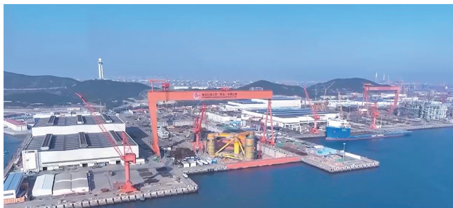
我国首个深远海浮式风电平台主体完工。