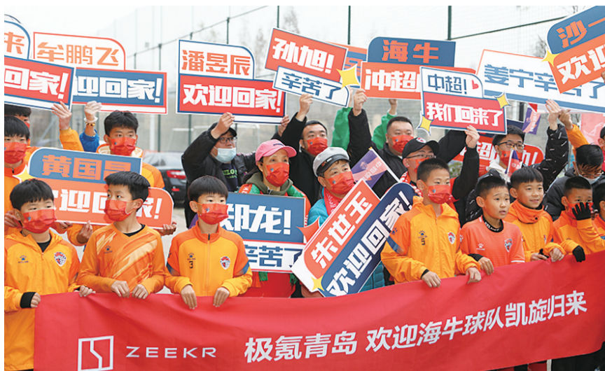
热心球迷现场打出横幅欢迎海牛将士。

16时许,大巴在车队的引领下缓缓驶入俱乐部基地,早已等候多时的人群中爆发出了热烈的掌声,球迷们举着“海牛将士辛苦了”“中超!我们回来了”的