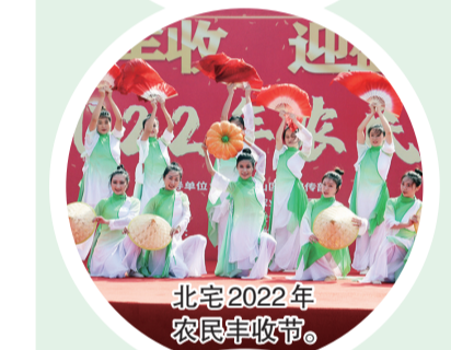
北宅2022年农民丰收节。