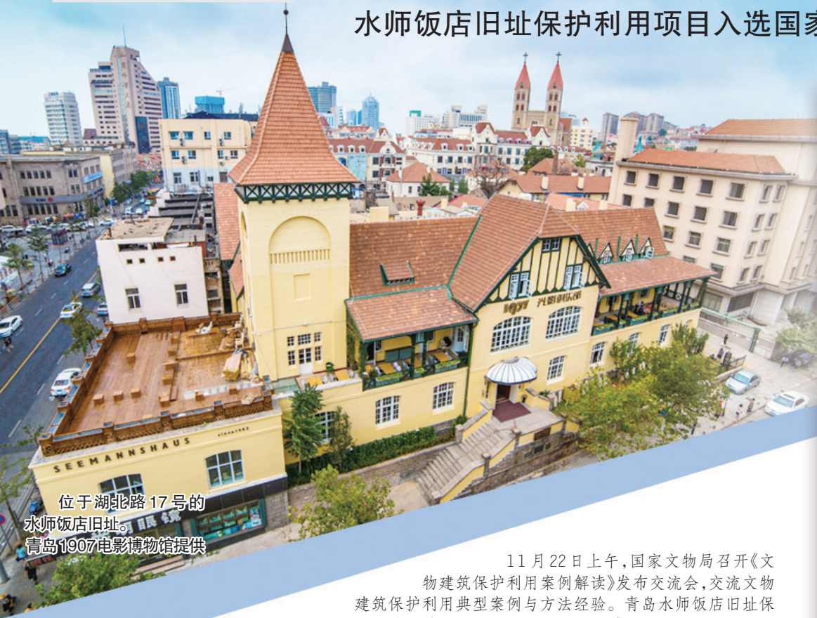
位于湖北路17号的 水师饭店旧址。