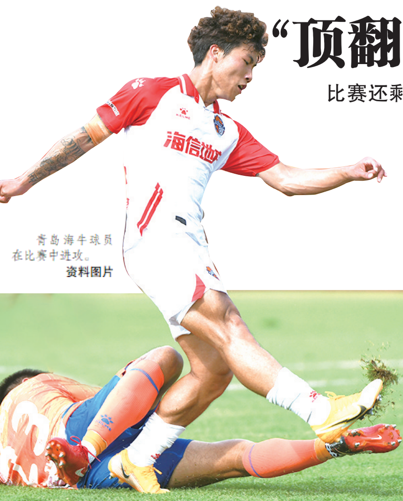
青岛海牛球员 在比赛中进攻。 资料图片